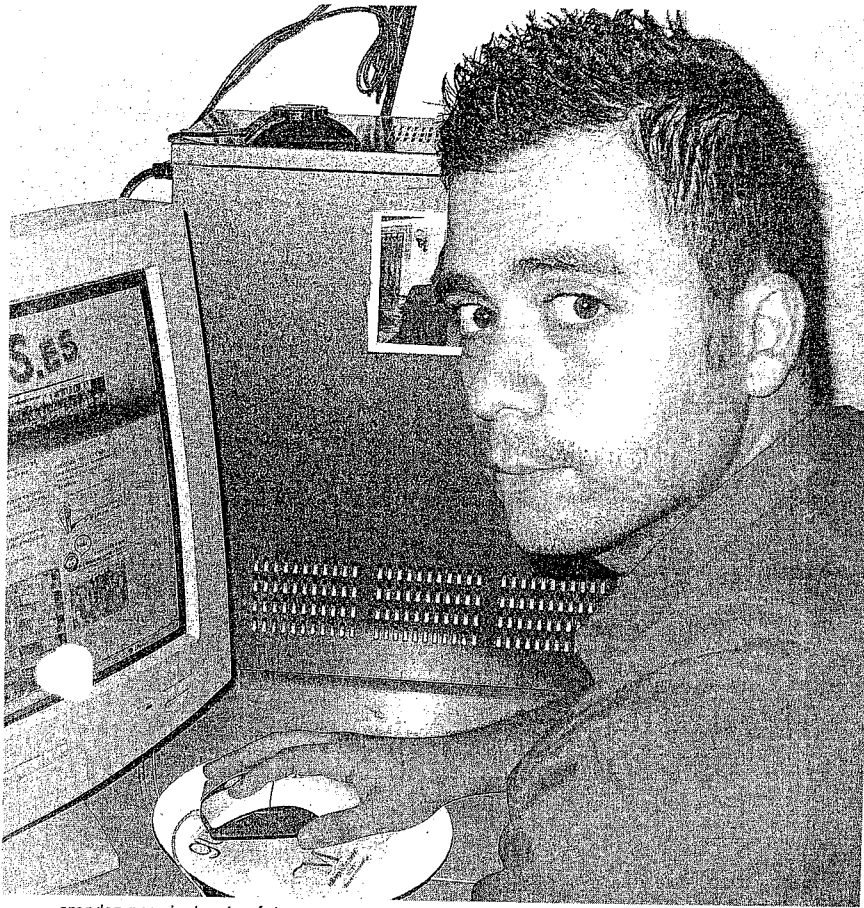
creador, posa junto a la página, que ha recibido cerca de 20.000 visitas en sus tres primeros meses.