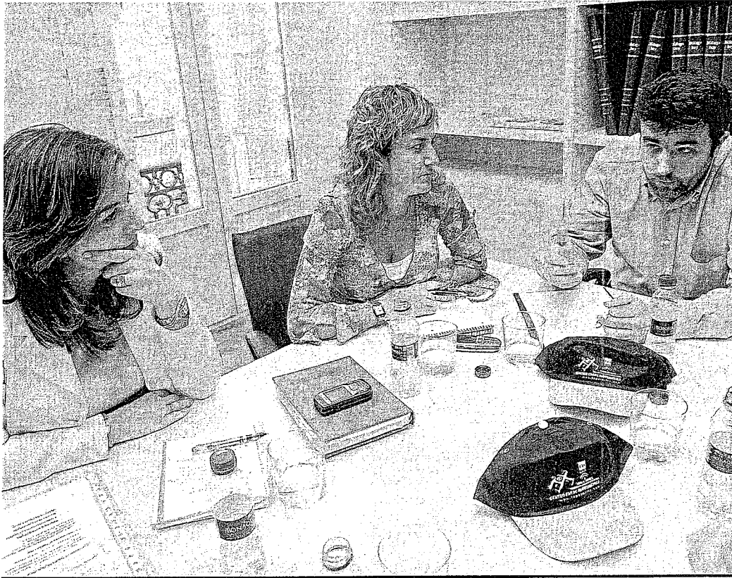
DEBATE. Un momento del encuentro celebrado para analizar el futuro de La Palmilla y sus necesidades más acuciantes.

Todos están de acuerdo en que la labor de la Policía, por la falta de medios, es mejorable, aunque reconocen la dificultad de investigar en la barriada